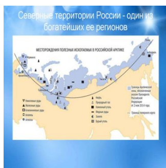
Рисунок 2 – Полезные ископаемые Арктики

Арктический регион обладает разнообразной экологической системой, состоящей из материковой тундр, береговых линий, островов, континентального шельфа и уникального ансамбля ледяных масс Северного Полярного океана (рисунок 3). Географические характеристики данной