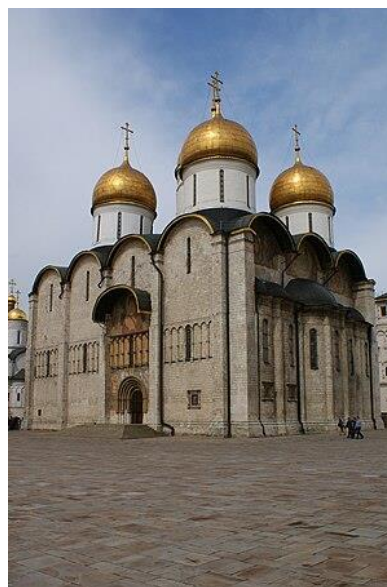
Рисунок 1 – Успенский собор Московского Кремля