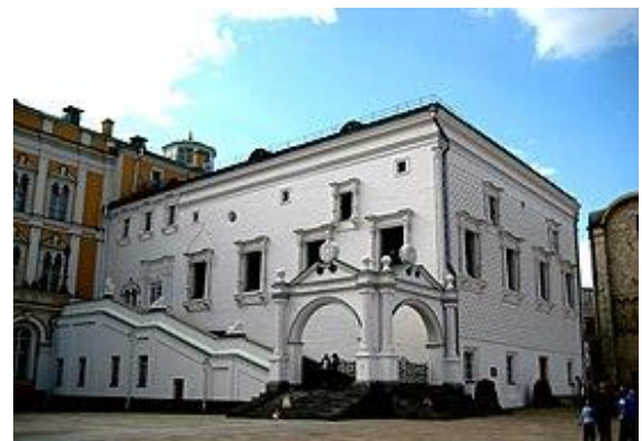
Рисунок 4 – Грановитая палата. Вид со стороны Красного крыльца

Бесполезность полемики в данном случае очевидна, ибо каждая сторона упорствует в настойчивом навязывании своей точки зрения и в итоге останется при своем мнении [1; 3, с. 50-56].