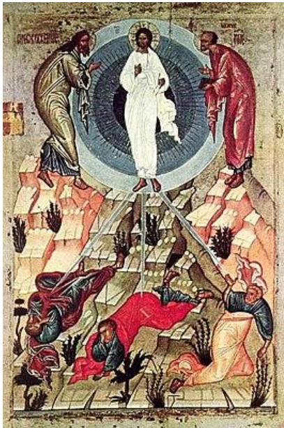
Рисунок 10 – Преображение Господне. Икона. Новгород. XV в.

славы Иисуса Христа, когда Он преобразился во время молитвы, и просияло лицо Его, как солнце, одежды же Его сделались белыми, как свет» (Мф 17:2).