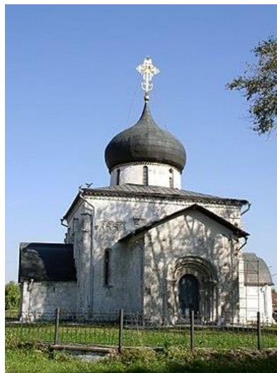
Рисунок 8 – Георгиевский собор в Юрьеве-Польском. 1230—1234

Аристотель Фьораванти искал способ гармонизации формы на основе равенства количественных отношений её частей. До того, как приступить к работе, он поехал по Руси и убедился в искусстве гармоничного сочетания природного и рукотворного, что особенно наглядно проявилось во владимиро-суздальских краях. Красота памятника архитектуры привычно им связывалась, во-первых, с его размещением, во-вторых, с упорядочиванием составных частей. В этом видел он источник всей прелести и красоты [8, с. 11].