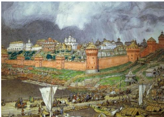
Рисунок 3 – Московский Кремль при Иване III. Художник А.М.Васнецов. 1921 г.

Как носитель психологии Ренессанса итальянский архитектор не был скован средневековой сакральностью, отошел от догматизма, тогда как Россия все еще была погружена в оторванную от жизни и практики религиозную схоластику с ее туманными кружениями на одном месте и бесплодными умствованиями.