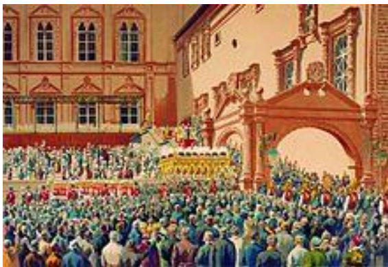
Рисунок 5 – Изображение Красного крыльца на картине И.К. Макарова (1822—1897) «Государь император клянется народу на красном крыльце»

Красное крыльцо (наружно ориентировано на Соборную площадь) – парадный вход в Грановитую палату.