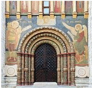
Рисунок 2 – Северная дверь Успенского собора

его руководством, был грандиозный и беспрецедентный. С таким масштабом и объемом Аристотелю сталкиваться не доводилось. Но было обстоятельство, которое сильно его разочаровало и огорчило. Это чисто ментальный момент. При дворе миланского герцога Сфорца мастер был своим человеком, вхожим в круг местной элиты, пользовавшийся уважением и почетом. В Московии, как сразу понял Аристотель, такой демократический формат отношений был исключен.