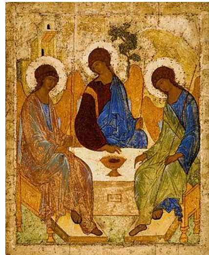
Рисунок 9 – Троица. Андрей Рублёв. 1411 или 1425—1427 гг.

Мягкое, ненавязчивое «очеловечивание» русским иконографом священных образов не противоречит разработанной традицией ортодоксального христианства символикe. В «Троице» практически отсутствует внешнее взаимодействие между фигурами. Ангелы отрешенно смотрят словно внутрь себя, но при этом спаяны воедино тихой молитвой, которую они безмолвно творят.