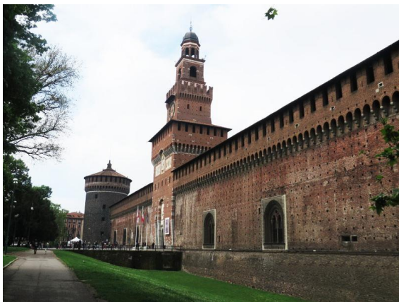
Рисунок 6 – Замок Сфорца в Милане. XIV в.

Красное крыльцо (наружно ориентировано на Соборную площадь) – парадный вход в Грановитую палату.