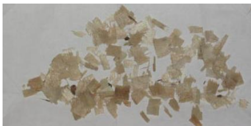
Рисунок 3 – Фрагменты древесины, представленной на исследование (по внешнему виду напоминающие древесные стружки, опилки)

Одновременно на исследование была представлена однородная смесь измельченного неизвестного вещества, по внешнему виду напоминающего древесные стружки, опилки. Средние размеры фрагментов 0,6х0,5 см и менее, сухие, плоские, бело-кремового цвета, без видимых каких-либо наслоений. Один из краев ровный, другой с зазубринами, с характерным древесным запахом. Признаки фитопатологических заболеваний, повреждения насекомыми не наблюдаются (см. рисунок 3).