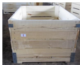
Рисунок 1 – Дощатый упаковочный ящик, представленный на исследование

На исследование представлен дощатый упаковочный ящик (см. рисунок 1).